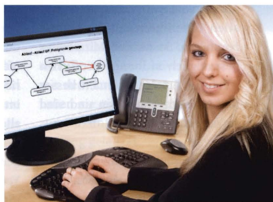
Der Einblick in die persönlichen Daten ist entscheidend.

Die AIDA Personalselbstauskunft als Self Service ist die modernste Form der Kommunikation im Bereich der Personalzeitwirtschaft. Mitarbeiter können ihre Zeitkontostände selbstständig am eigenen Bildschirm abrufen sowie die Produktzeiterfassung bequem mit dem virtuellen Personalbüro durchführen – entweder mit direkten Beginn- und Ende-Meldungen oder mit rückwirkender Zeitverteilung auf die einzelnen Produkte und Kostenstellen. AIDA gleicht die Arbeitszeiten ab und zeigt den Mitarbeitern auf, an welchen Tagen noch wie viel Arbeitszeit auf Produkte und Kostenstellen zu